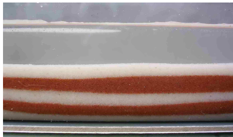
Strati successivi continui quasi orizzontali in una scatola di plastica piena d'acqua.

C'è una serie di principi scientifici chiave che ci aiutano a chiarire la successione degli eventi geologici. Questi hanno nomi che sembrano complessi, ma sono molto semplici da dimostrare, comprendere e usare. Nell'insieme prendono il nome di "Principi di stratigrafia". Alcuni sono in effetti "principi" che di solito applichiamo (ma ci possono essere circostanze specifiche inusuali dove non possiamo farlo), mentre altri sono "leggi" che applichiamo sempre. Proviamo a insegnarli usando una dimostrazione come questa.