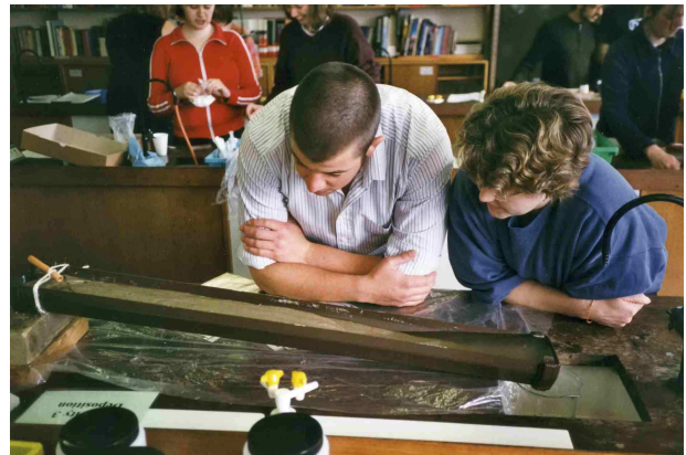
Lærerstudenter studerer sedimenttransport i en vannrenne.

Der vannet flyter rolig kan det være mulig å se de partiklene med størst tetthet hope seg opp. Utvasking av tette mineraler, som for eksempel gull, skjer på denne måten. Andre materialer med stor tetthet, som jernfilspon eller knust svovelkis, kan tilsettes sandblandingen for å få tilsvarende effekt.