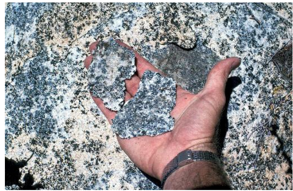
Fracturación de la superficie externa (exfoliación) de una roca ígnea, California