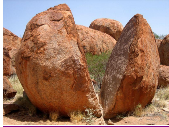
The Devil's Marbles, Australia – un gran bloque fracturado por meteorización debida principalmente a temperaturas extremas

A continuación, pídeles que intenten calentar una roca formada por un solo mineral, como la cuarcita, para comprobar su predicción sobre la rapidez con que se romperá. (No lo pruebe con calizas, si lo sugieren, porque el calentamiento de las calizas produce una fracturación de carácter más químico que físico).