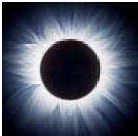
Eclisse di Sole

Questa attività dimostra come un oggetto piccolo, quando è vicino, può impedire la vista di un oggetto molto più grande situato più lontano. Pensate che spesso il Sole e la Luna sembrano avere la stessa dimensione nel cielo? In effetti non hanno affatto la stessa dimensione e tuttavia la Luna può nascondere completamente il Sole, tanto che viene quasi buio. Questo fenomeno è chiamato eclisse totale di Sole (o eclisse solare). Possiamo usare un semplice calcolo, basato su quanto avviene durante un'eclisse solare, per scoprire la dimensione del Sole (il suo diametro). In questa attività vi mostriamo come si può fare usando dei modelli di cartone, con cui potrete trovare il diametro del modellino di Sole. Lo stesso principio si usa per trovare il diametro del Sole (quello vero).