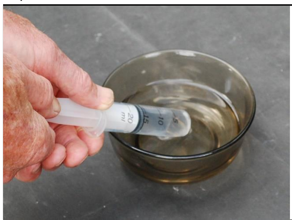
Llenando la jeringa con el agua casi hirviendo de un plato.

La presión ¿tiene algún efecto sobre la temperatura a la cual tienen lugar los cambios de estado entre sólidos, líquidos y gases? Pruebe esta demostración con sus alumnos (vigilando la seguridad pues se usa agua caliente). Hierva un poco de agua y viértala en un plato pequeño. Con esta agua, llene una jeringa de 20ml hasta aproximadamente la marca de los 15ml. (Asegúrese de que no quedan burbujas de aire accionando el émbolo adelante y atrás un par de veces). Ahora, selle el extremo de la jeringa con un poco de Blutak™ o similar.