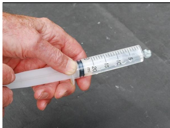
El agua de la jeringa empezando a hervir y a producir burbujas de vapor de agua a medida que disminuye la presión al tirar hacia atrás el émbolo.

Esto indica que el agua está hirviendo, incluso ahora que la temperatura está por debajo de los 100°C. Las burbujas están formadas por vapor de agua y no por el aire del exterior.