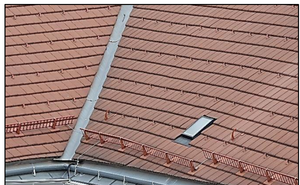
Paranieves en un tejado en Viena, Austria.