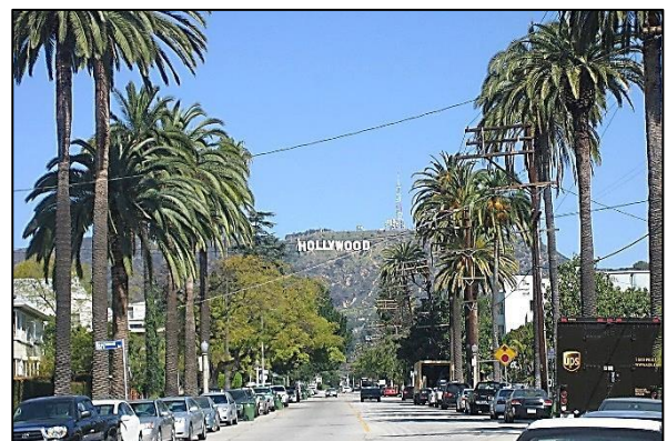
Palmeras en una región cálida, Hollywood, California, USA.

Licencia de GerritR bajo Creative Commons Attribution Share Alike 4.0 International License