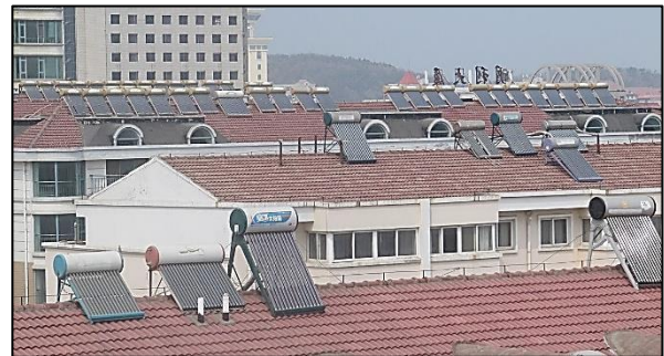
Paneles de agua solar caliente en Weihai, Shandong, China.