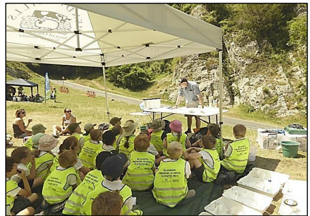
Una clase de primaria recreando las rocas ante la “Roca de las Edades”, una secuencia inclinada de calizas del carbonífero en Burrington Combe, Mendip Hills, suroeste de Inglaterra. (Amber Avery)

Explique que esta secuencia de Earthlearningideas ha mostrado cómo las rocas que eran al principio sedimentos que se depositaron horizontales antes de transformarse en una roca sedimentaria inclinada en la forma que podemos observar ahora.