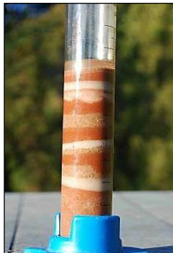
Capas en una secuencia sedimentaria en una probeta. (Peter Kennett).

Muestre cómo se depositan los sedimentos en capas llamadas estratos vertiendo capas de sedimentos de diferentes colores (incluidos los que acaban de hacer) en una probeta como en la actividad Earthlearningidea “Depositando el ciclo de las rocas”. Explique que esto depositaría las capas de una secuencia sedimentaria, incluso si los sedimentos fuesen del mismo color y no las pudiésemos ver.