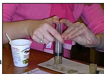
“Haciendo roca” con sedimento y escayola. (Peter Kennett).

Dé a cada grupo una jeringa serrada, escayola, la “receta” y el resto de material necesario para hacer una “roca” a partir del sedimento por compactación y cementación con la Earthlearningidea “Haz tu propia roca”. Probablemente no tendrán suficiente sedimento de la actividad anterior y necesitarán más (ver la lista de material más adelante). Deberían enjuagarlo todo en cubos al acabar.