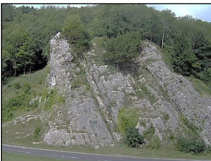
La “Roca de las Edades” y la señal que marca su posición.

Puede debatir con su clase si el Rev. Toplady tenía razón al usar la frase “Roca de las Edades”, teniendo en cuenta que no tenía ni idea de la edad de las rocas en aquel tiempo (ahora sabemos que las calizas carboníferas en que se refugió tienen unos 330 millones de años de edad).