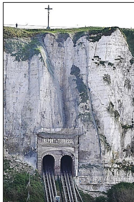
Túnel de tren en un penya-segat de creta, Le Treport, Normandia, França.