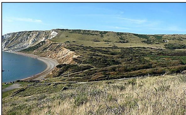
Una carena de creta i un espadat de creta, amb roques més dèbils al fons, Tyneham Gwyle, Dorset, Anglaterra.

La calcària fina i blanca anomenada creta és tan “tova” que es pot usar per escriure en una pissarra i, tanmateix és prou dura per formar penya-segats alts i carenes. Això és perquè tot i que es fàcil trencar la roca, té moltes fractures i esquerdes que permeten un ràpid drenatge de l'aigua de pluja, tot reduint d'aquesta manera els efectes erosius de l'aigua. Altres roques “toves” poden ser similars.