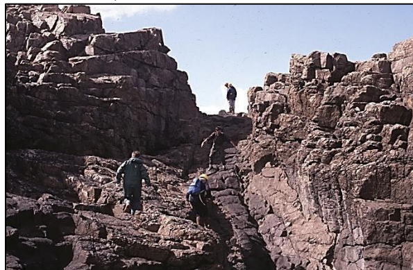
Un dic meteoritzat de basalt en mig d'una roca més resistent, Orkney, Escòcia.

Tot i que les roques ígnies són normalment molt dures i resistents i, per això, constitueixen terres altes, els minerals que formen les roques ígnies fosques poden ser menys resistents a la meteorització i l'erosió que els minerals de les roques del seu voltant, formant així terres baixes.