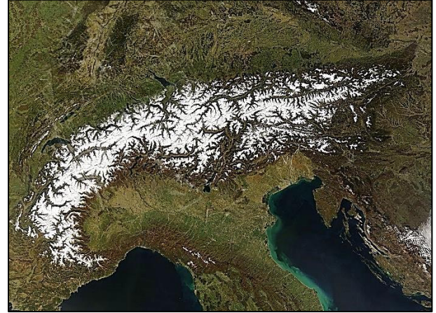
Els Alps, a Europa, coberts per la neu, amb roques més antigues i, sovint, més dures, a cada banda.

Imatge de domini públic – creada expressament per la NASA.