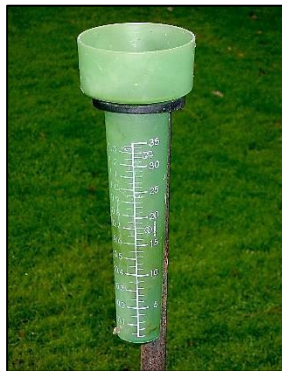
Un pluviòmetre senzill usat en Alemanya.

Imatge del dispositiu d'Stevenson de Bidgee sota llicència Creative Commons Attribution-Share Alike 3.0 Australia. Imatge del pluviòmetre de Kolling sota els termes de la GNU Free Documentation License, Version 1.2