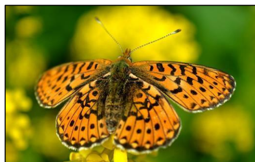
Donzella rogenca Boloria euphrosyne – els números d'aquesta espècie semblen ser sensibles al canvi climàtic.