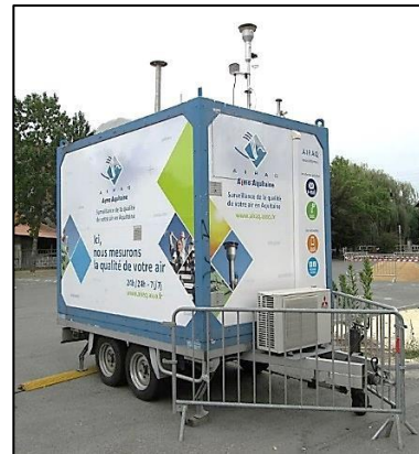
Estació de mesura de la qualitat de l'aire a França.