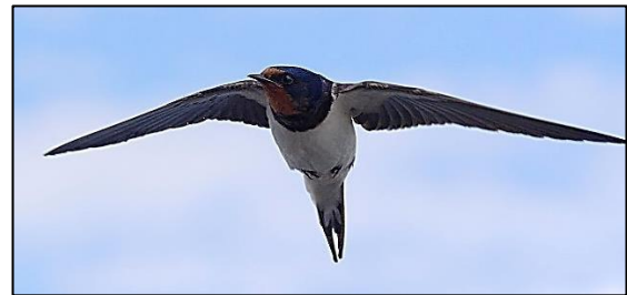
Una oreneta migrant, Alemanya.