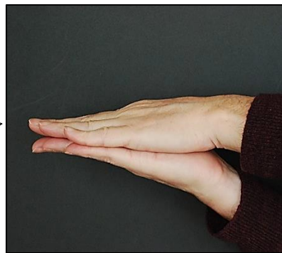
Més capes dipositades a sobre per formar una seqüència sedimentària horitzontal.