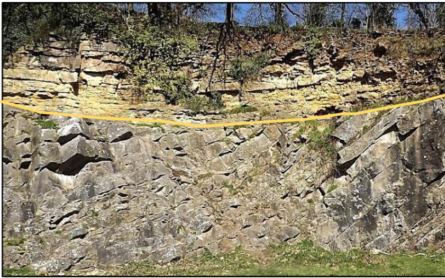
Discordança angular amb capes superiors sub-horitzontals – la discordança de Henry De La Beche, Vallis Vale, Somerset, GB. Calcària carbonífera gris a sota; calcària juràssica beige a sobre.

Podeu demostrar la seqüència dels esdeveniments geològics que generen una discordança usant les vostres mans.