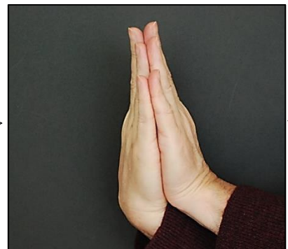
Seqüència transformada en roques sedimentàries; inclinada en la formació d'una serralada, milions d'anys més tard.