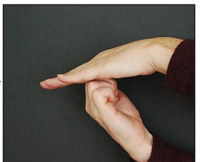
Milions d'anys més tard, tota la seqüència és inclinada en un nou episodi de formació d'una serralada (algunes discordances no han estat inclinades).