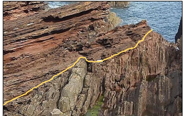
Discordança angular amb tota la seqüència basculada cap a l'esquerra - Siccar Point Berwickshire, est d'Escòcia, GB. Gresos grisos sub-verticals a sota; gresos devonians vermellosos a sobre. (David Bailey).