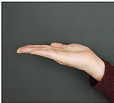
Una capa dipositada horitzontalment.