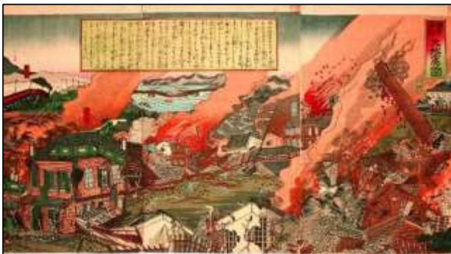
La ciudad de Gifu destruida por el terremoto Mino-Owari de 1891