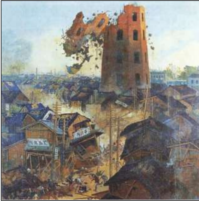
"Colapso del 1º terremoto en el piso 12"