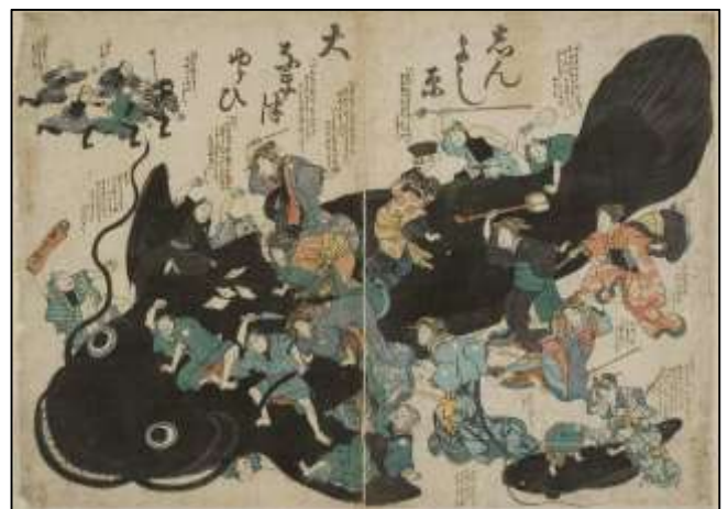
“La causa del gran terremoto de Shin Yoshiwara”, Edo 1855 Las mujeres culpan a un siluro del terremoto, pero él está encantado de estar con ellas y amenaza con retorcerse nuevamente (causando una réplica)

La mayoría de la gente creía que los terremotos eran causados por un poder divino. En el caso del terremoto japonés que se muestra debajo, se creía que había sido causado por un siluro.