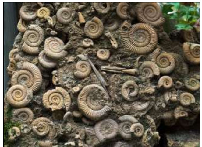
Grup d’ammonits trobat al Brazil