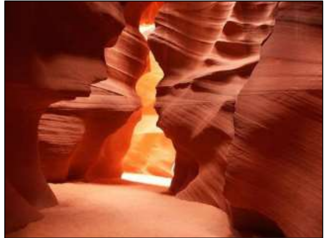
Antelope Canyon, Navajo Tribal Park, Arizona, USA