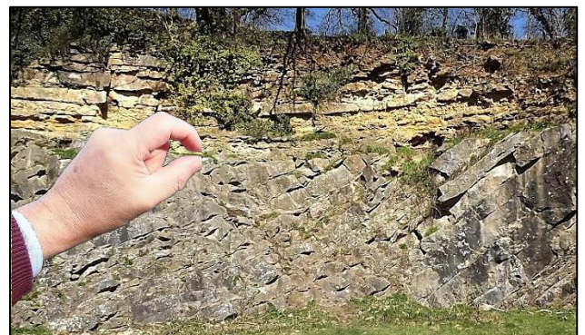
La discordancia de Henry De La Beche, Vallis Vale, Somerset, GB. Caliza carbonífera debajo; caliza jurásica encima.

Pruebe a explicar la historia de otras discordancias angulares, como la descubierta por otro geólogo famoso, Henry De La Beche, en Somerset, GB.