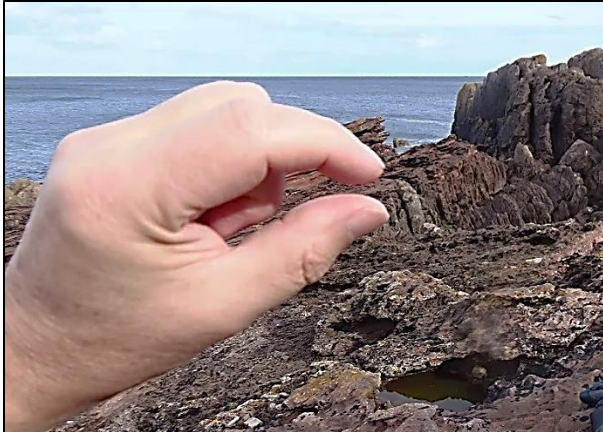
Encuadrando una discordancia. (David Bailey).

Ayúdelos a ver el espacio tan minúsculo del que les habla encuadrando la línea de discordancia entre el índice y el pulgar, tal como se muestra aquí.