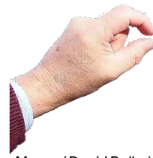
Mano. (David Bailey).

Este ejercicio se puede utilizar para cualquier discordancia angular en el campo o en una foto. Puede superponer esta mano sobre cualquier foto que tenga de una discordancia angular.