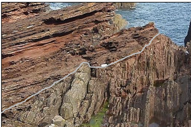
La discordancia de Siccar Point, Escocia, con la discordancia marcada. (David Bailey).

Aquí el índice y el pulgar encuadran la discordancia angular de Siccar Point entre las rocas casi verticales del Silúrico de debajo y las rocas superiores inclinadas del Devónico; la laguna temporal de la discordancia es de unos 55 millones de años.