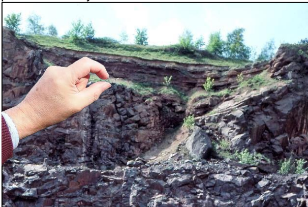
Valle erosionado en rocas precámbricas erosionada, rellenado, por encima de la discordancia, por sedimentos triásicos, Newhurst Quarry, Charnwood Forest en los Midlands, Inglaterra. (Peter Kennett).

Otro ejemplo de cómo usar este método se basas en la discordancia angular entre rocas precámbricas y triásicas de la foto: