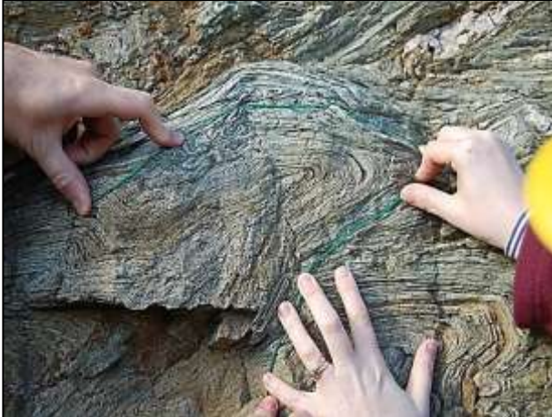
Medida de pliegues en las rocas precámbricas de South Stack, Anglesey, GB. (Chris King).

Utilice una cinta métrica o un trozo de cordel para medir alrededor de un pliegue (o pliegues) para obtener la longitud original de la capa antes del plegamiento. A continuación, mida la distancia nueva entre los dos extremos del cordel o la cinta, cuando aún estén alrededor del pliegue, para averiguar su separación después del plegamiento.