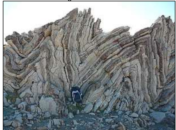
Rocas plegadas en Creta, la mochila tiene 30cm de ancho. (Pete Loader)

Este método se puede utilizar en el campo o sobre una foto como la siguiente.