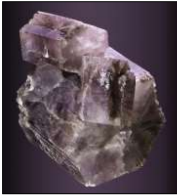
Aragonito (Ver fuente al final)

Pregunte a sus alumnos ¿cuál de las siguientes muestras es el carbonato de calcio más puro? A continuación, guíe la discusión para obtener las mejores respuestas (como se muestra en las notas más adelante).