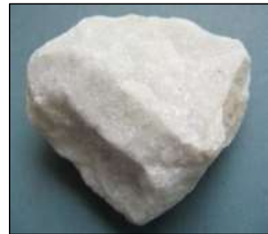
Mármol (Peter Kennett para ESEU)