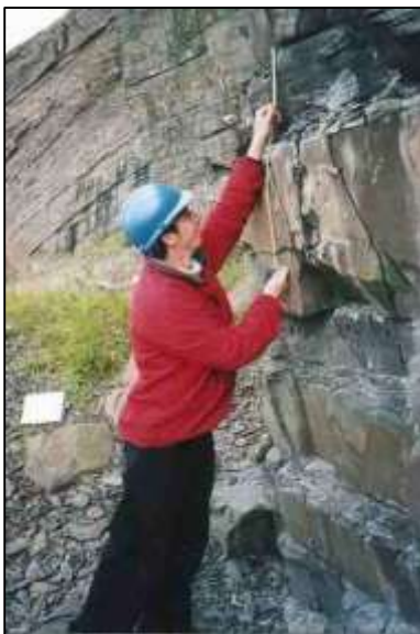
Medición del espesor de las capas en las Areniscas de Aberystwyth, Gales, GB. (Peter Kennett).