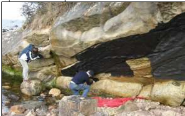
Obtención de moldes de pisadas de Hibbertopterus , un escorpión acuático carbonífero. (Dave Williams y Dee Edwards).

Se pueden hacer moldes de detalles clave que se podría perder, como pequeños restos de fósiles o pistas de pisadas usando Plastilina™ o látex; más adelante se podrían hacer reproducciones a partir de estos moldes.