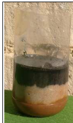
Un ejemplo de "rocas" dejadas al sol para su secado