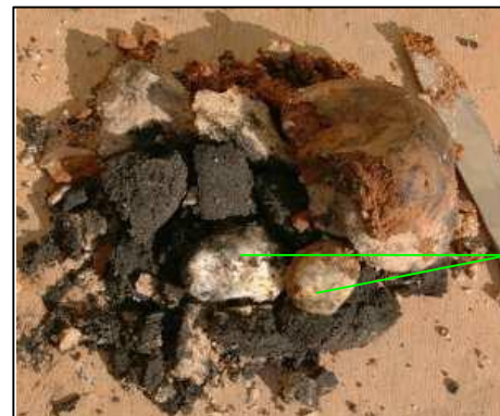
Los resultados tras unas pocas horas