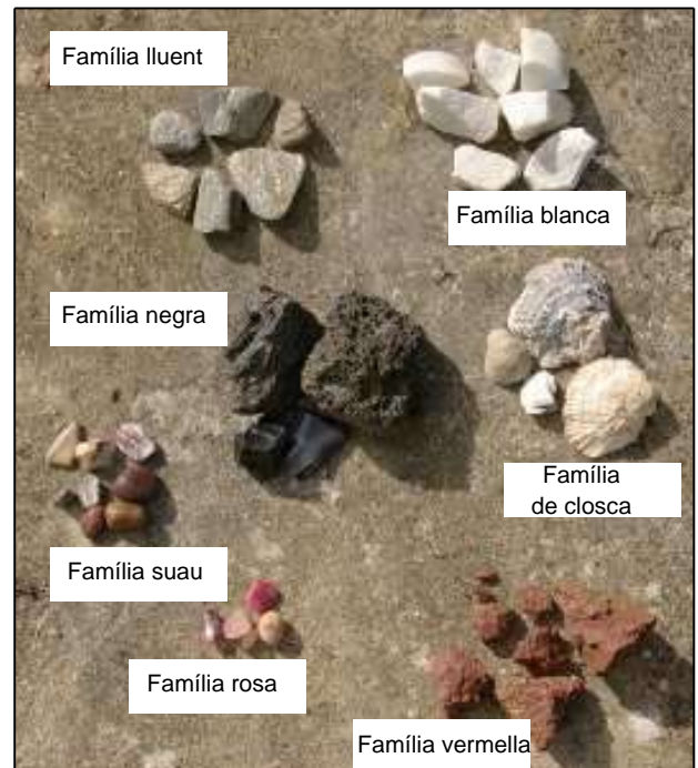
Les famílies de roques/fòssils

"El pare i la mare Vermell van tenir quatre fills i llavors van rebre la sorpresa de tenir bessons."