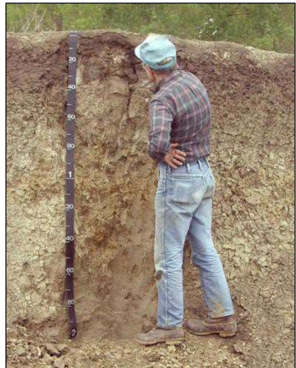
Un científico del suelo examinando un perfil.

Original del U.S. federal government, esta imagen es de dominio público.