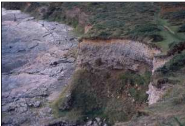
Perfil de suelo sobre un afloramiento. (Peter Kennett).