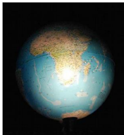
El 22 de desembre