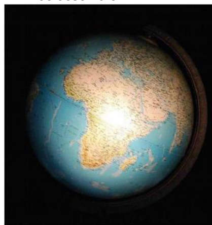
El 21 de mars