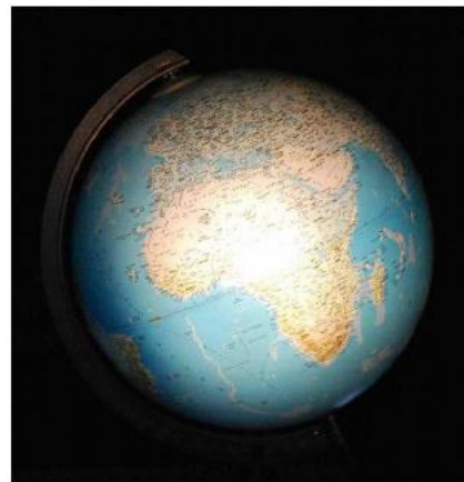
El 21 de setembre

Ara repetiu la "passejada" al voltant de l'any, però aquest cop, atureu-vos a cada data i gireu el globus lentament. Demaneu als alumnes que observin la longitud relativa del dia i la nit a la seva pròpia latitud. De la llista de "principis subjacents" que es donen més endavant, remarqueu aquells que creieu adequats a l'edat dels vostre alumnes.