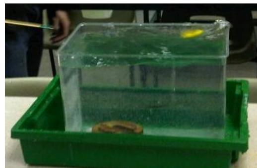
El "depósito del Krakatoa" creando tsunamis.

Fotos de "antes" y "después" de Lucy Greenwood.